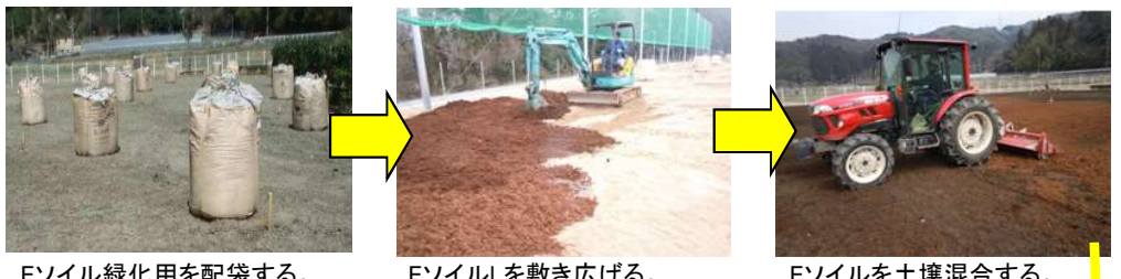
Eソイル緑化用を配袋する。

Eソイルと現況土壌を混合するだけで、碎石層、暗渠排水管は不要。 グランド緑化は、はげにくい丈夫な芝緑化が可能。 クレイ工法は、長期間、排水性に優れ、泥濘化、泥沼化しにくく、表層土が硬くならず柔らかい。