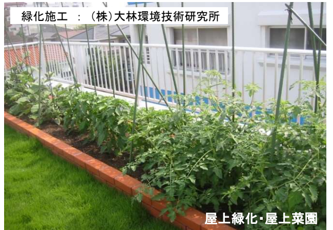
屋上緑化・屋上菜園