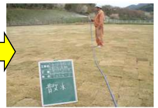
専用肥料散布、かるく転圧後、散水する。

お問合せ zero emission & energy conservation