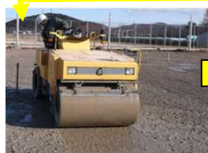
2トンローラーで転圧する。 (クレイ工法はこの作業まで)