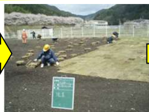
その上に張芝する。